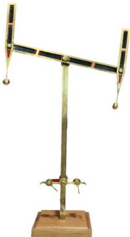
Maquette de télégraphe optique Système CHAPPE Orange - CHT- Inv.n°200

Ce système de transmission à distance est effectué par des appareils situés à intervalle le long